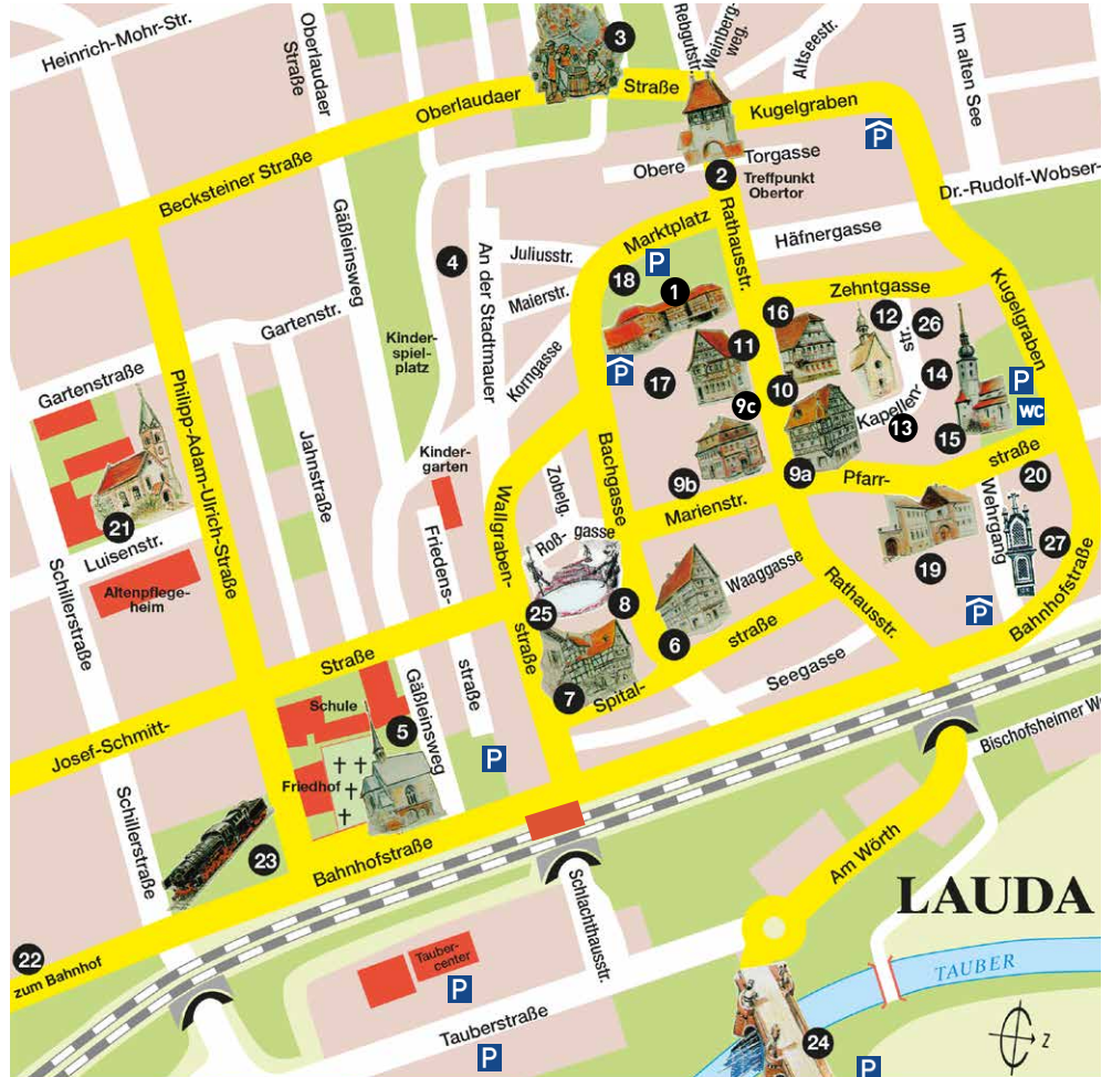
Grafik: Heimat- und Kulturverein Lauda e.V.