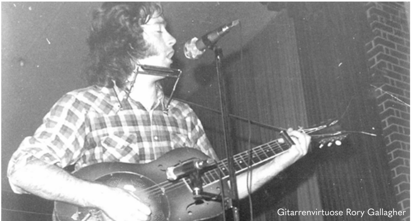
Gitarrenvirtuose Rory Gallagher