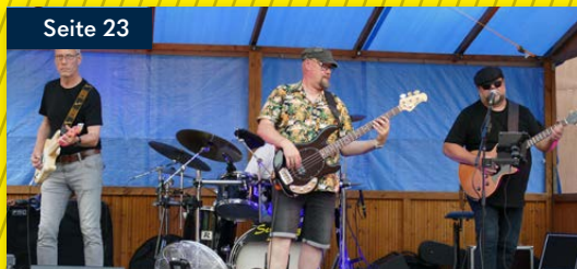
Weinfest in Lauda