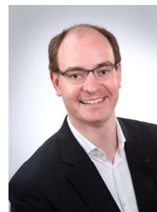
Schirmherr: Bürgermeister Lukas Braun