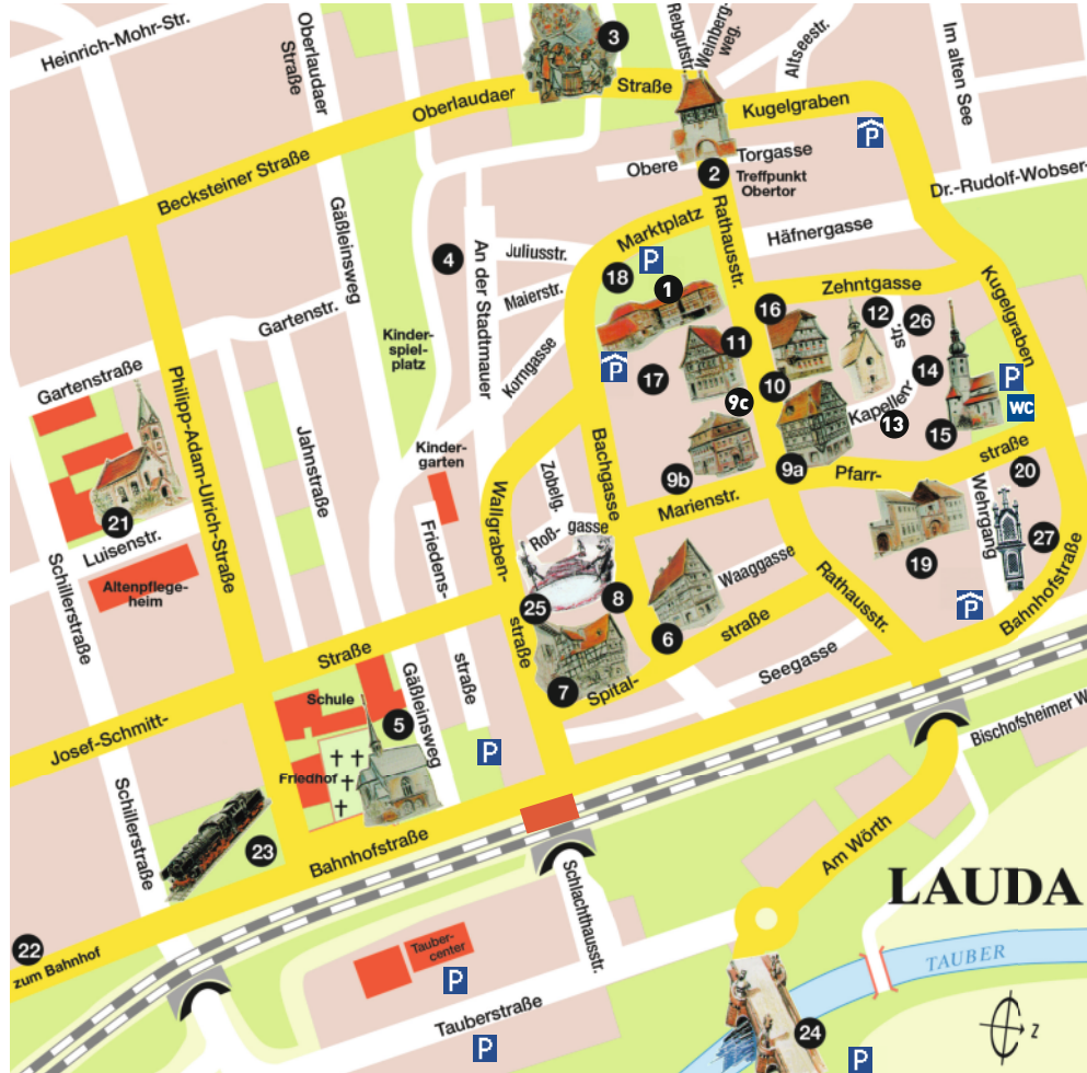
Grafik: Heimat- und Kulturverein Lauda e.V.